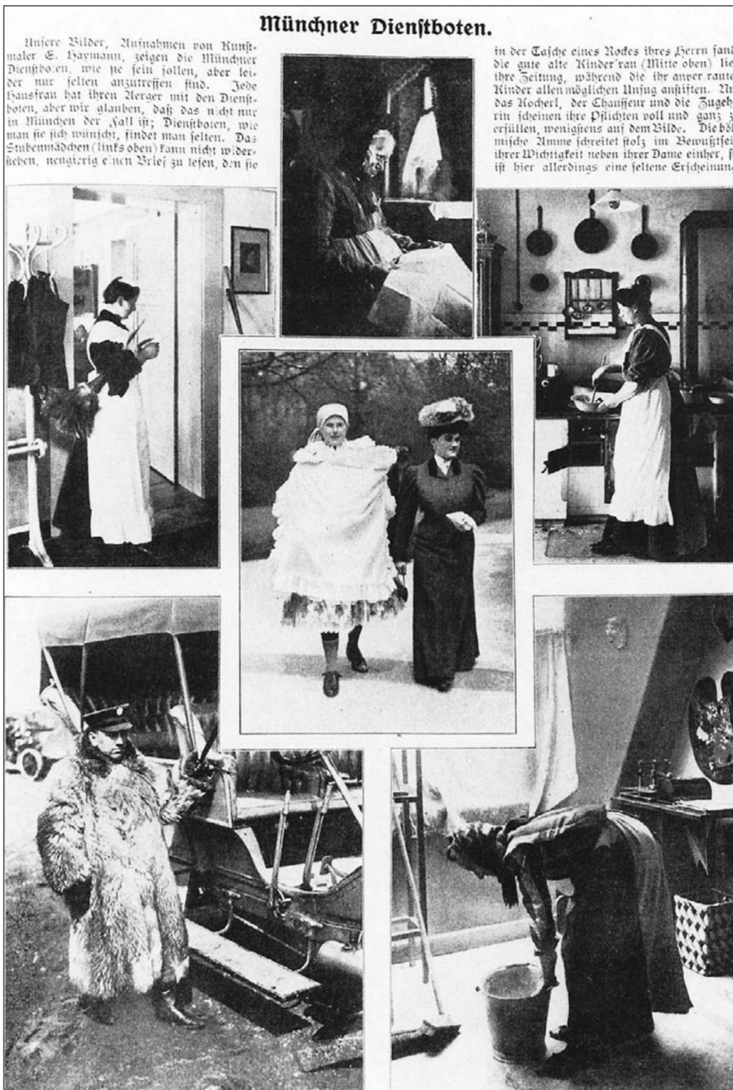
1907 wurde die unwürdige Bezahlung und Behandlung des Hauspersonals luthals beklagt. Zwei Jahre später stellte die „Münchener Illustrierte Zeitung“ den Münchner Dienstboten ein recht fragwürdiges Zeugnis aus: Vielfach fehlte es an Fleiß und Zuverlässigkeit. Die Collage, die eine ganze Zeitungsfülle füllte, zeigt (im Uhrzeigersinn, von oben) die Kinderfrau, das „Kocherl“, die Zugeherin, den Chauffeur und das Stubenmädchen. In der Mitte eine böhmische Amme beim Spaziergang neben ihrer Dame.

Eine Umfrage der Stadt bei den Geschäftsverbänden ergibt eine deutliche Mehrheit für eine totale Sonntagsruhe. Einer steigenden Beliebtheit erfreuen sich die „Automobil-Droschken“, im Laufe des Monats wird ihre Zahl von 25 auf 30 steigen.