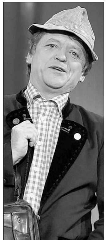
Frank-Markus Barwasser alias Erwin Pelzig

Im Dantestadion findet vor Tausenden von Zuschauern das erste Münchner Frauenfußballspiel statt, das Westdeutschland mit 4:2 gegen Westholland gewinnt. ■ hw